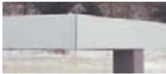
Standard: 4-seitig umlaufende Attika verzinkt

Kostenlose Hotline: 0 800 / 3 46 37 46 Wir beraten Sie gern!