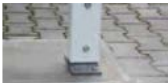
Höhenverstellung über Stützenfüße (+15/-5 cm) durch Rohr-in-Rohr-System.

Für den Carport stehen zurzeit folgende Ausstattungselemente zur Auswahl: