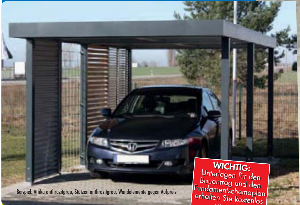
Beispiel: Attika anthrazitgrau, Stützen anthrazitgrau, Wandelemente gegen Aufpreis

WICHTIG: Unterlagen für den Bauantrag und den Fundamentschemaplan erhalten Sie kostenlos von uns.